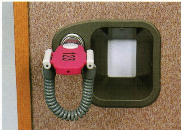
ロッカー取り付け状態 (当社カード錠への取り付け例)