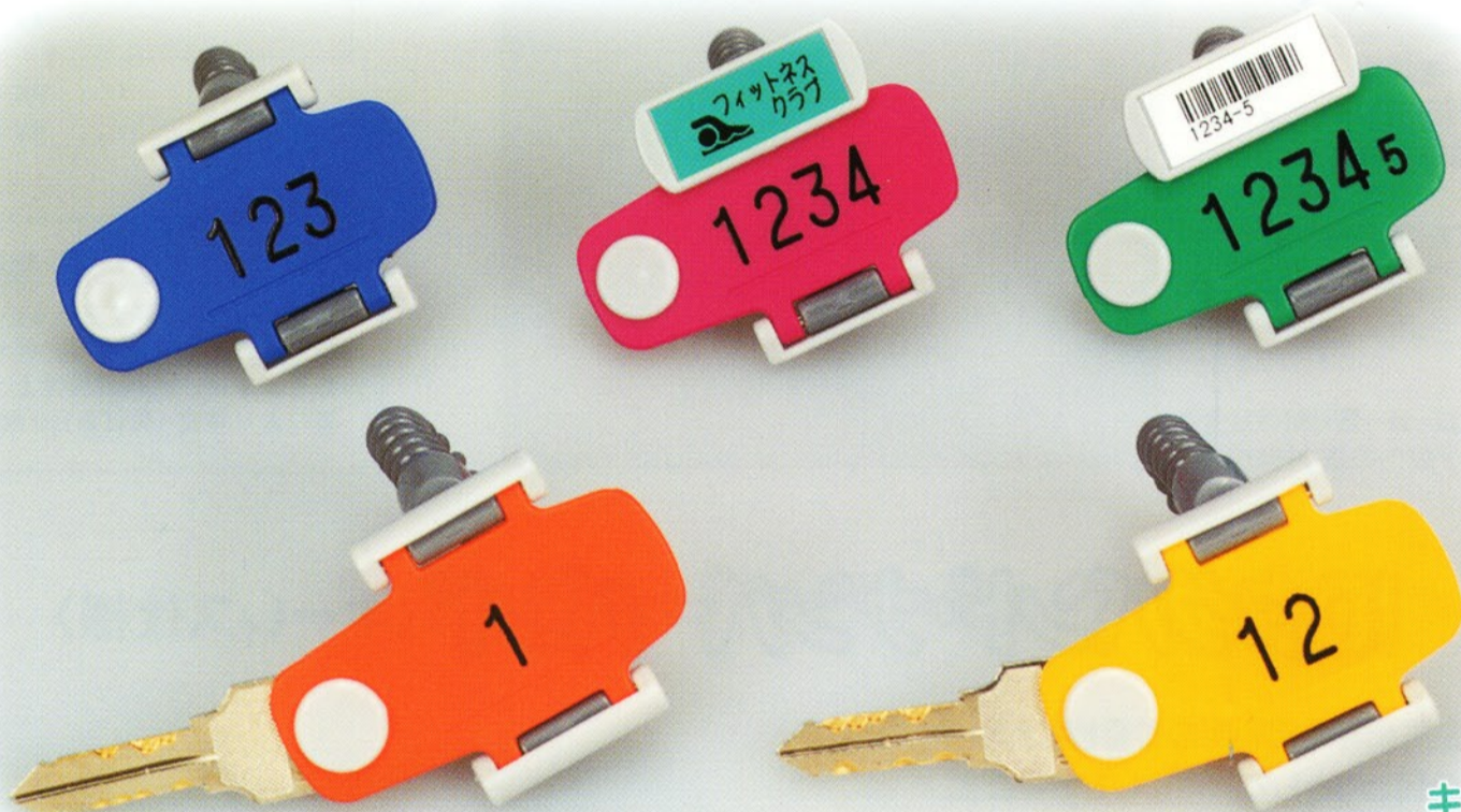
キー・オ・メイトRK型 ポリウレタン仕様